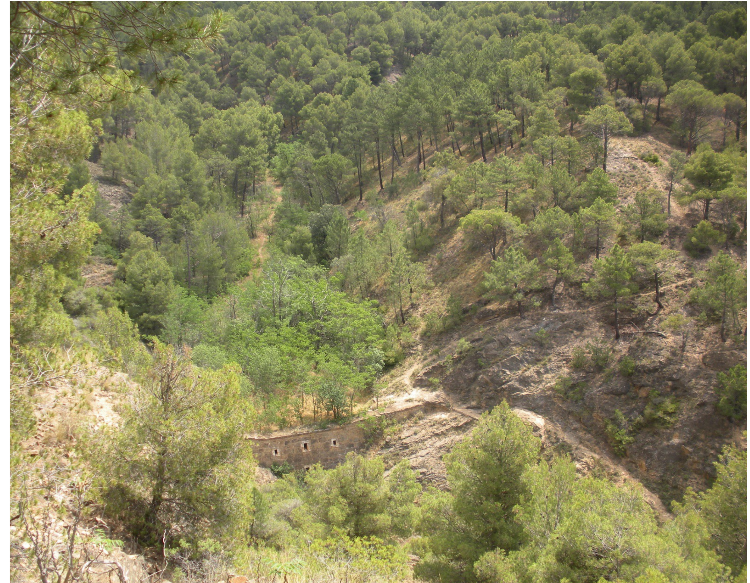
Pinar de Daroca